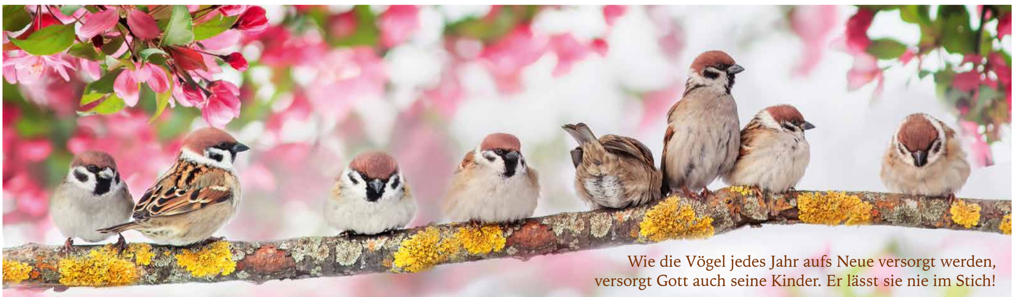
Wie die Vögel jedes Jahr aufs Neue versorgt werden, versorgt Gott auch seine Kinder. Er lässt sie nie im Stich!

Zu beachten ist hier die Wortwahl: es wird von Gott zugesagt, dass wir in der Obhut des guten Hirten keinen Mangel leiden werden. Dies ist keine Zusage von Reichtum, Luxus, Bequemlichkeit oder Annehmlichkeiten eines abgesicherten Lebens. Aber es ist eine Zusage der Versorgung mit dem, was wir bedürfen.