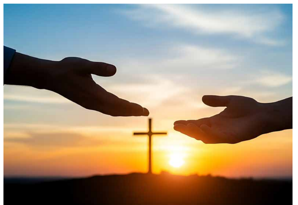
Jesus streckt dir Seine Hand entgegen.